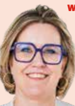
Vicevoorzitter - secretaris

Wij behartigen de belangen van de ondernemers. We hebben gewerkt aan een nieuw jaarplan dat nu in de afrondende fase is."